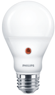
LEDbulb E27 A19