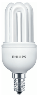
LPPR ECONCFLG 0033